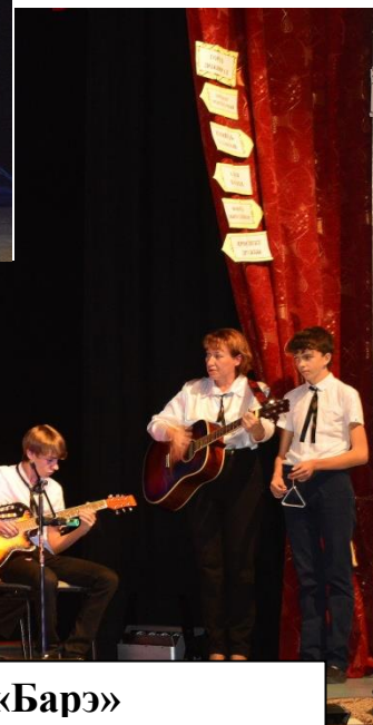
На сцене ансамбль «Барэ»