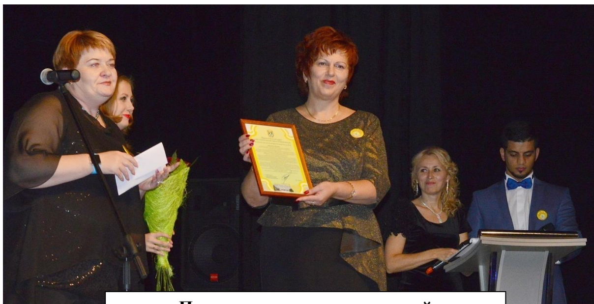
Поздравления высоких гостей