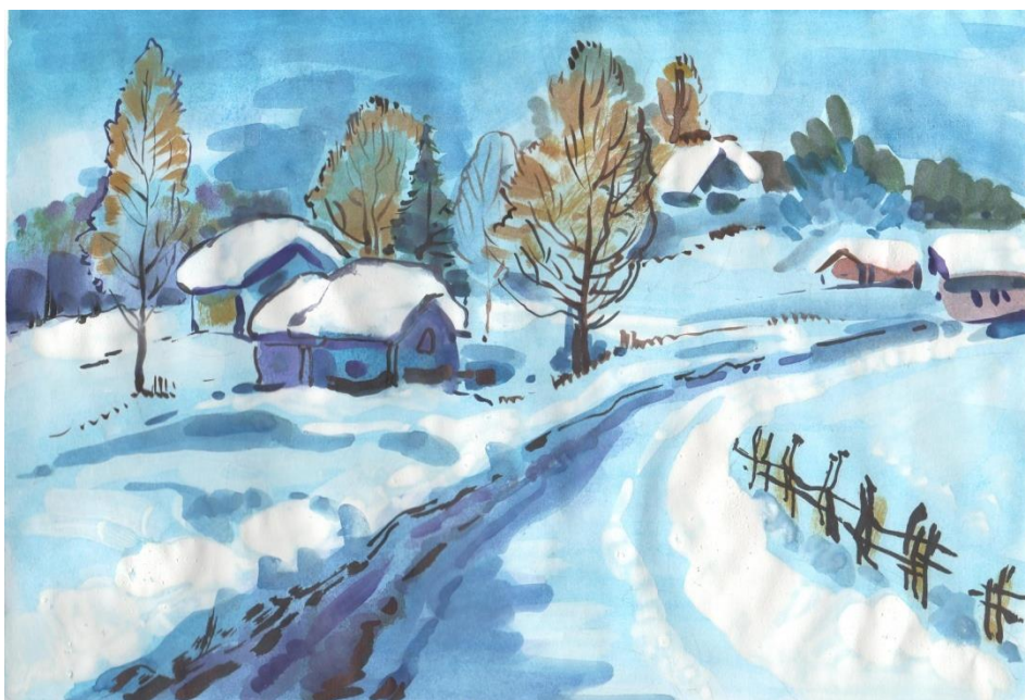
Рисунок Валерия Руцкого, 5А класс