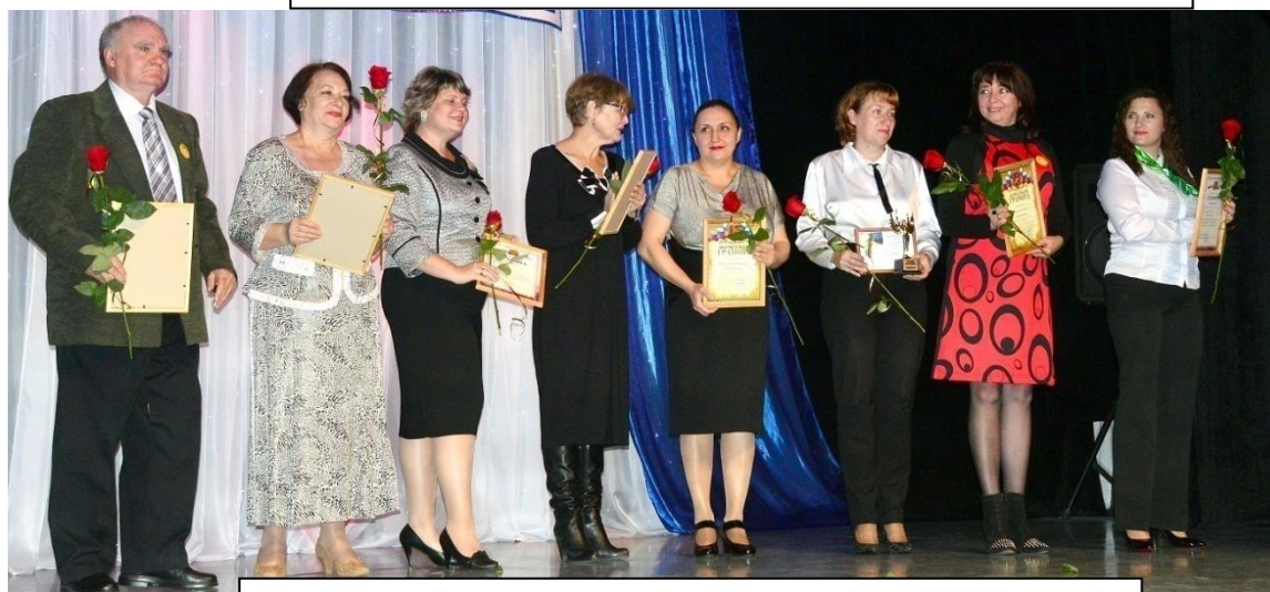
Награды - достойным