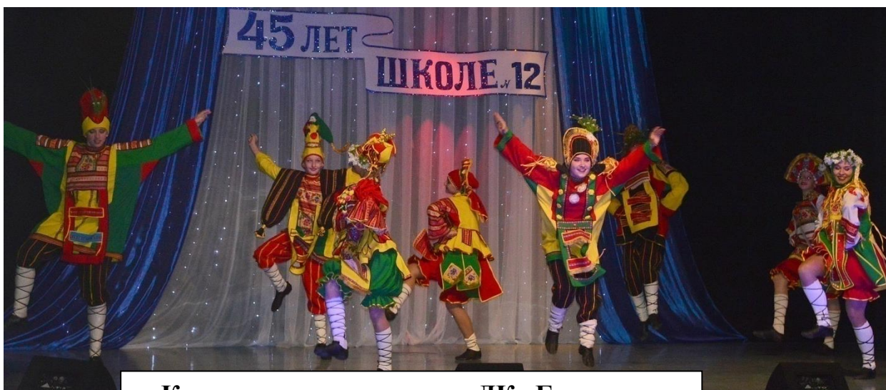
Красочные поздравления ДК «Горького»