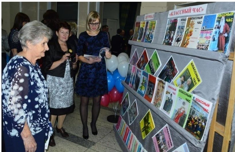
Наша гордость – журнал «Классный час»