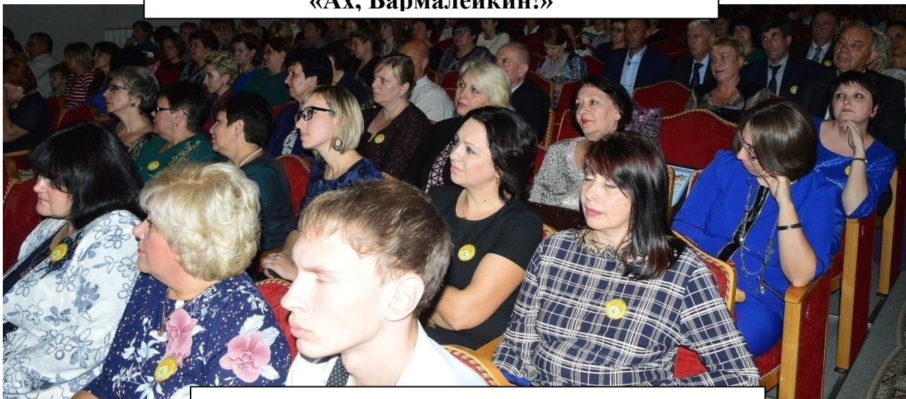
В зале много гостей